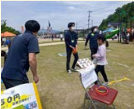
ラピュタの筍ご飯